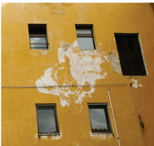
Particolare degrado facciata Sud