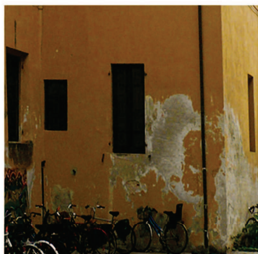
Particolare degrado facciata Ovest