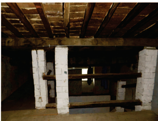
Vista del sottotetto