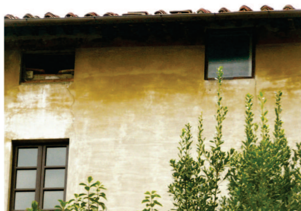
Particolare degrado facciata Ovest