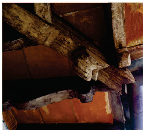
Particolare travetti facciata Est