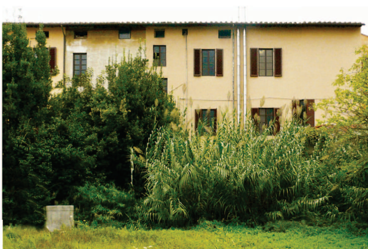
Vista generale facciata Ovest