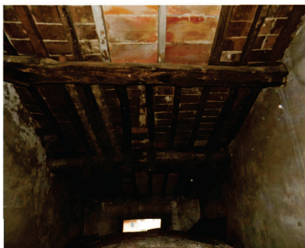
Vista del sottotetto