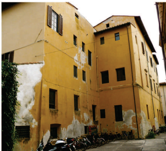
Vista generale facciate Sud-Ovest