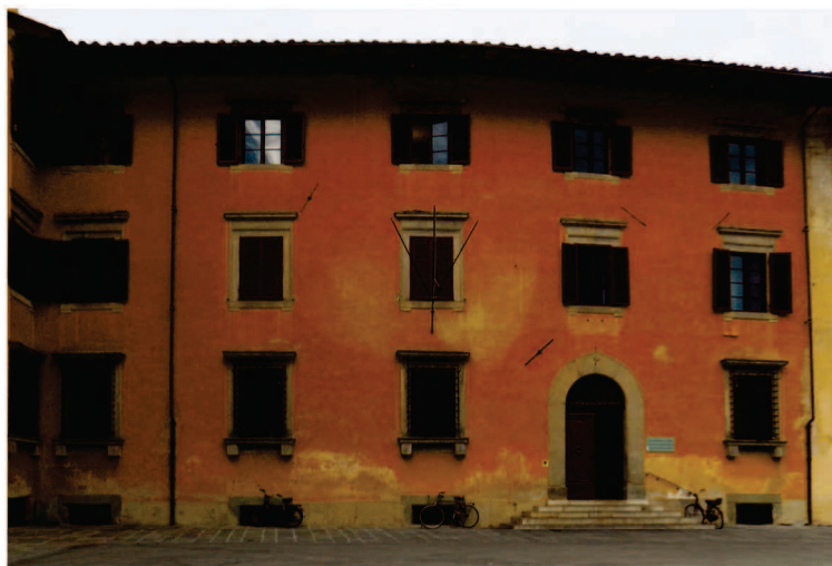
Vista generale facciate Nord-Est