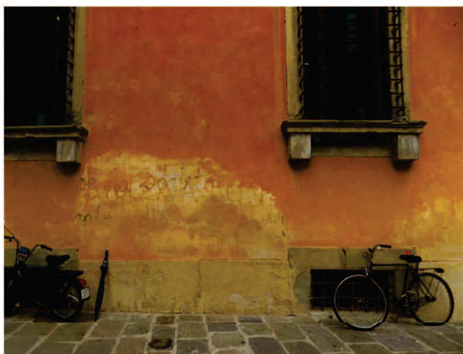
Particolare degrado facciata Est