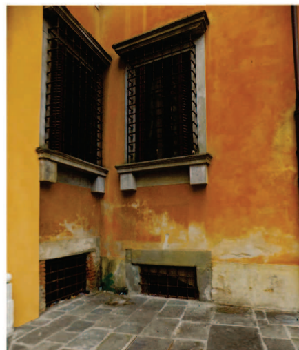
Particolare degrado facciate Nord-Est