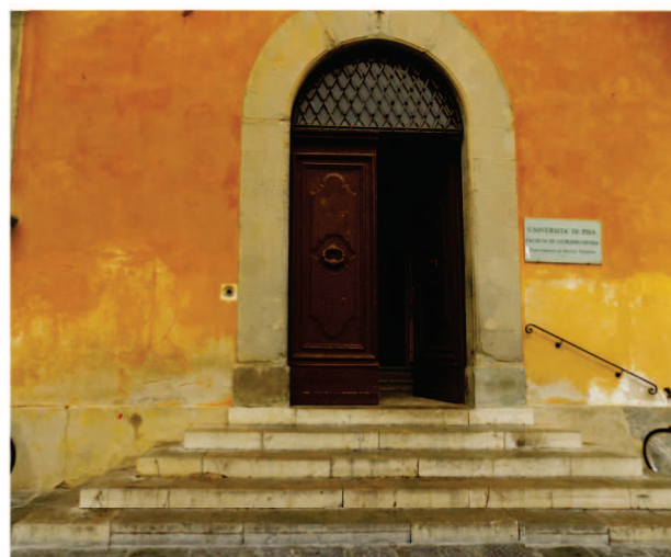
Particolare degrado portone d'ingresso facciata Est