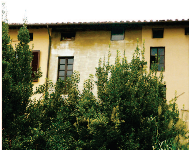
Particolare facciata Ovest