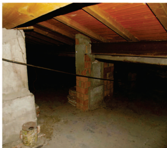
Vista del sottotetto