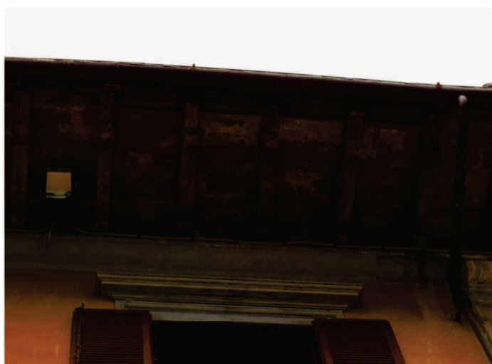
Particolare sotto-gronda facciata Est