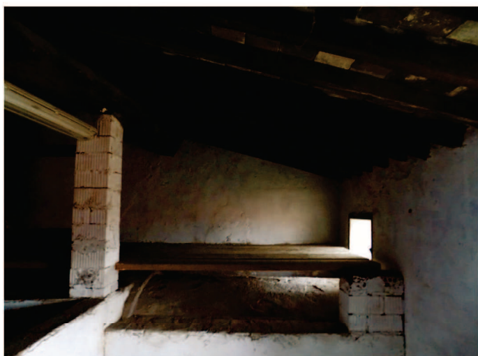
Vista del sottotetto