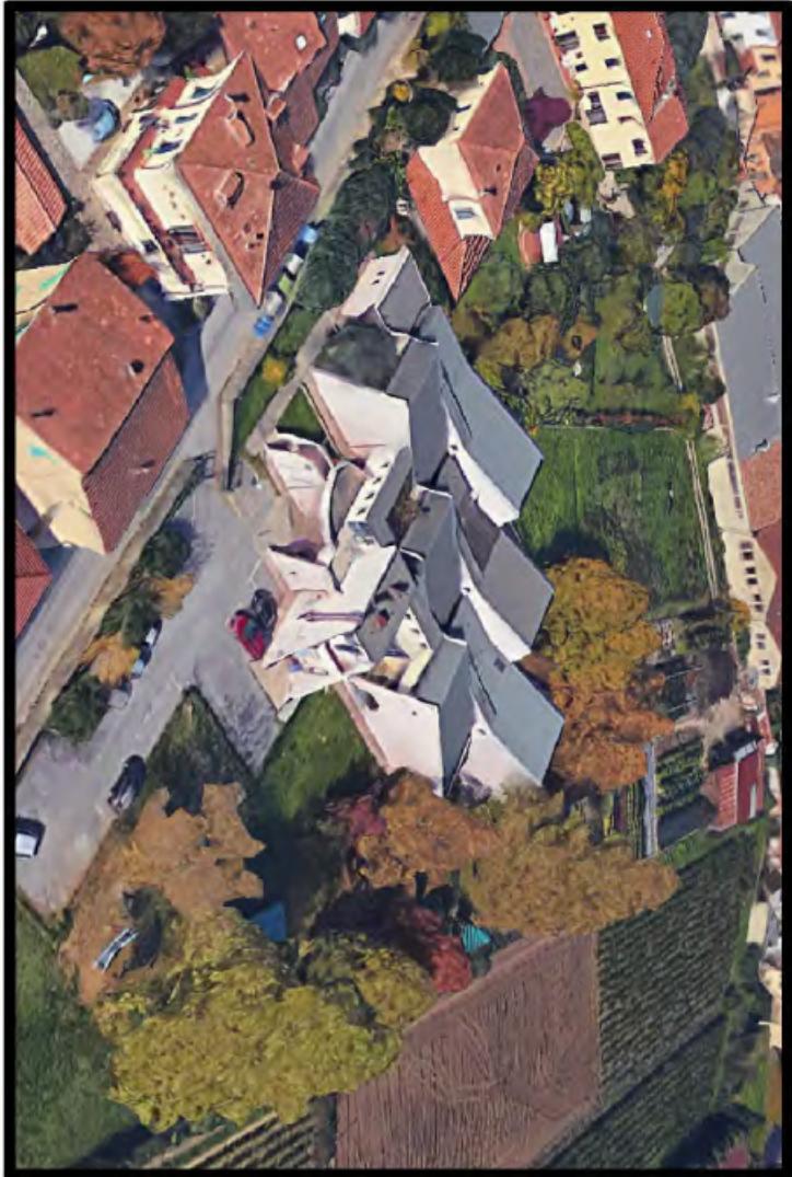
Layout di Cantiere