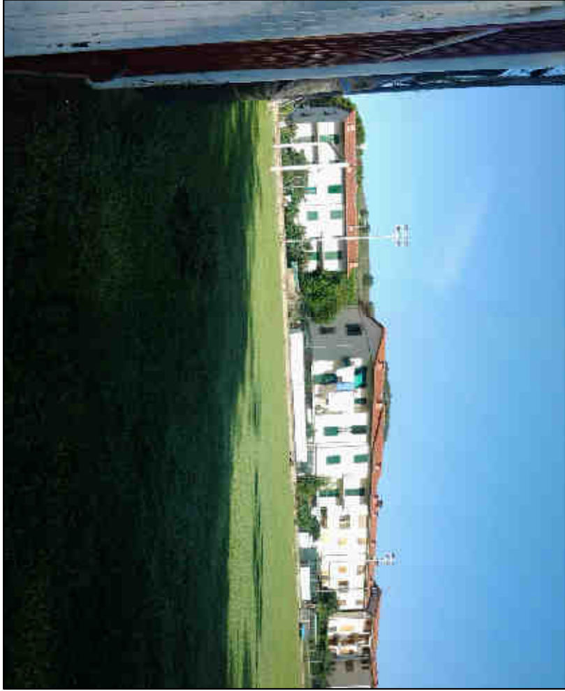
IMMAGINE VISUALE 5A