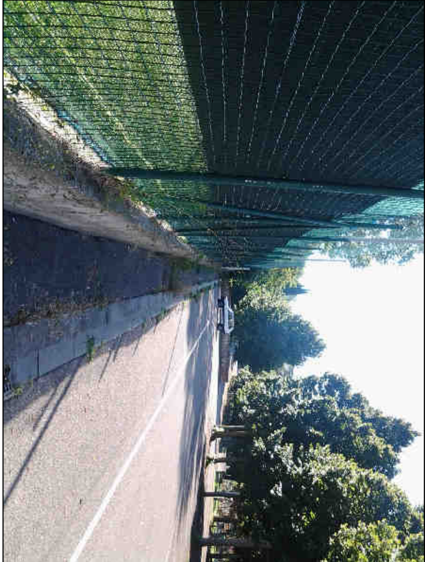
IMMAGINE VISUALE 4