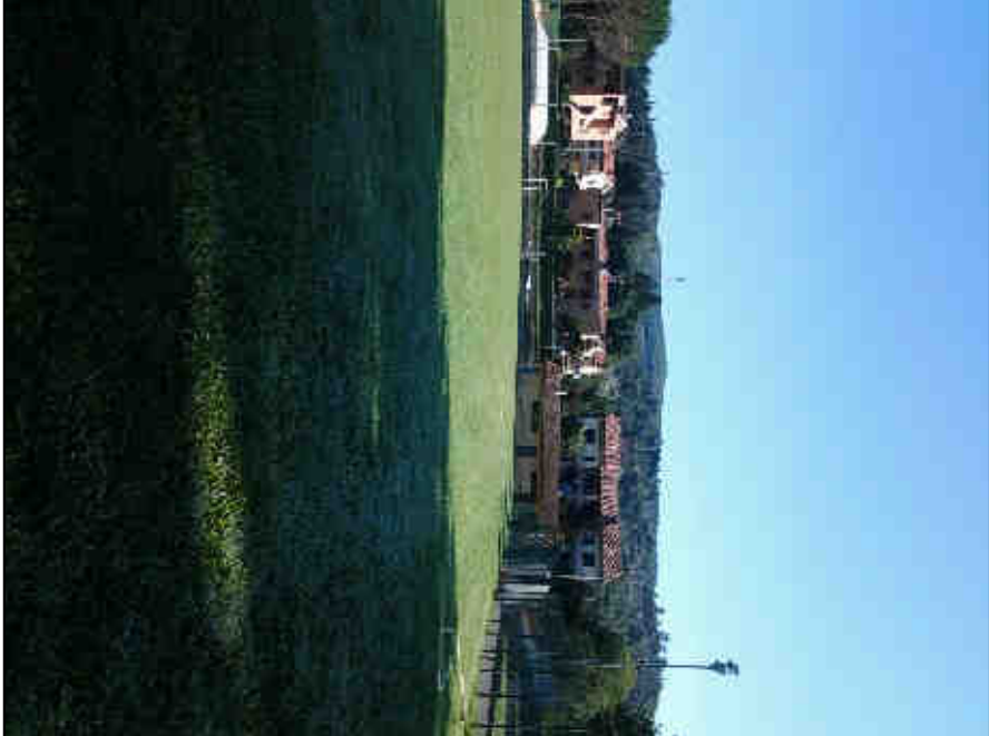
IMMAGINE VISUALE 5C