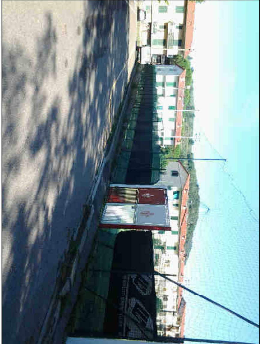
IMMAGINE VISUALE 3