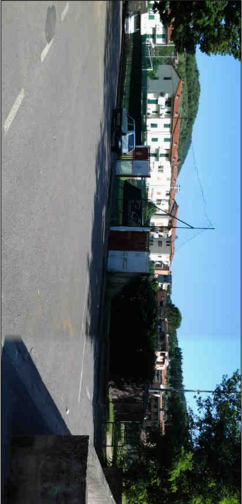
IMMAGINE VISUALE 2