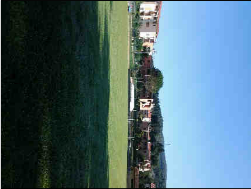
IMMAGINE VISUALE 5B