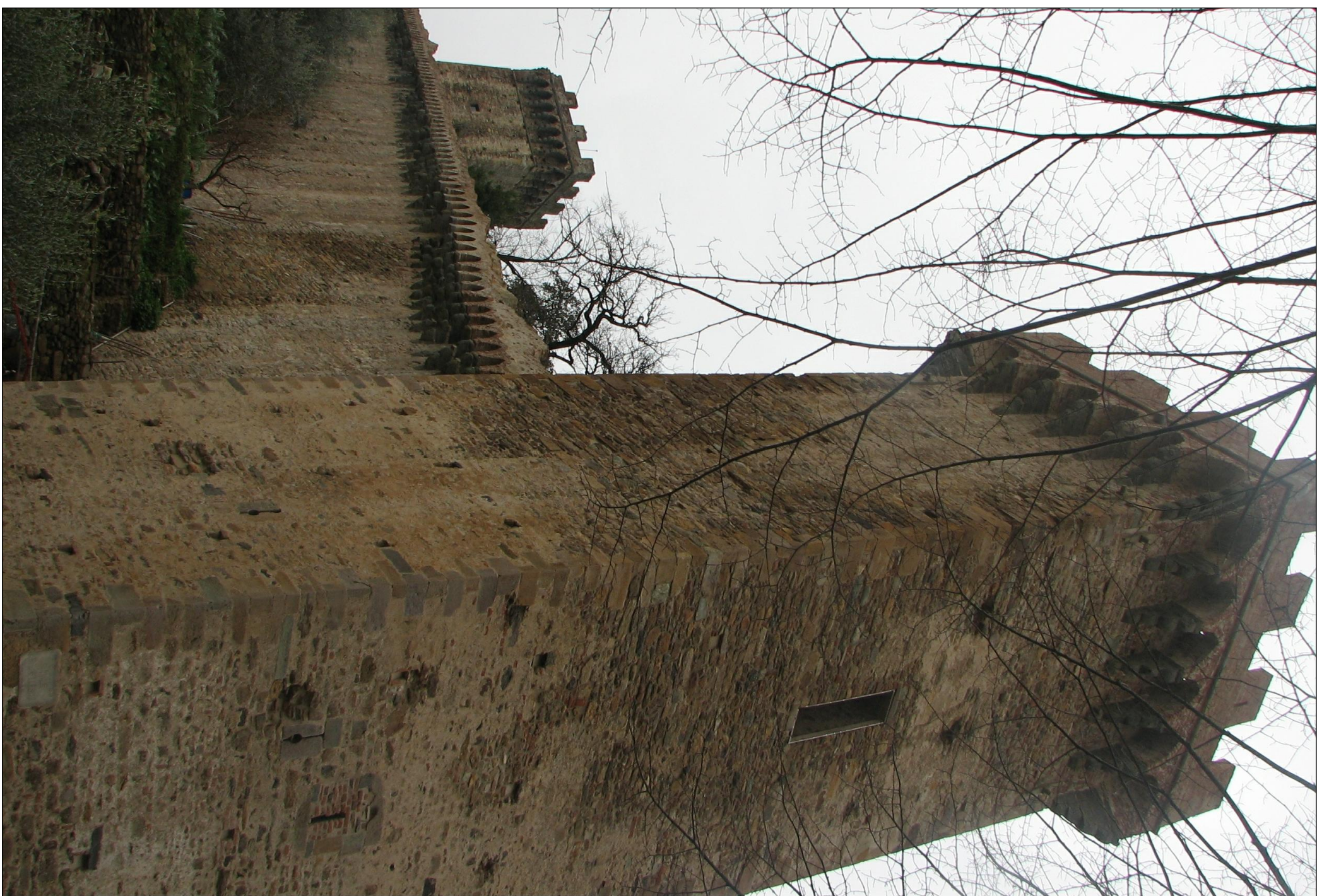
Foto del complesso dopo il restauro