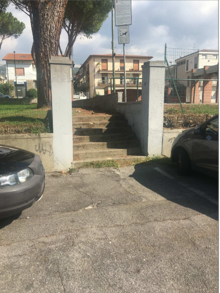
Scale di accesso al giardino