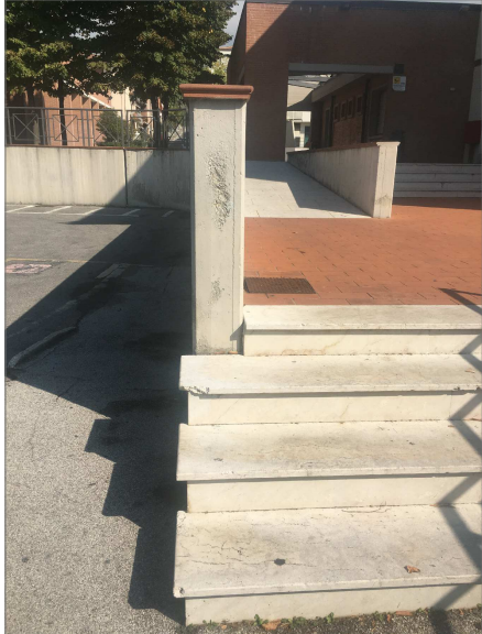
Scale di accesso alla piazza