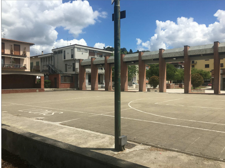
Pavimentazione piazza e relativo massetto