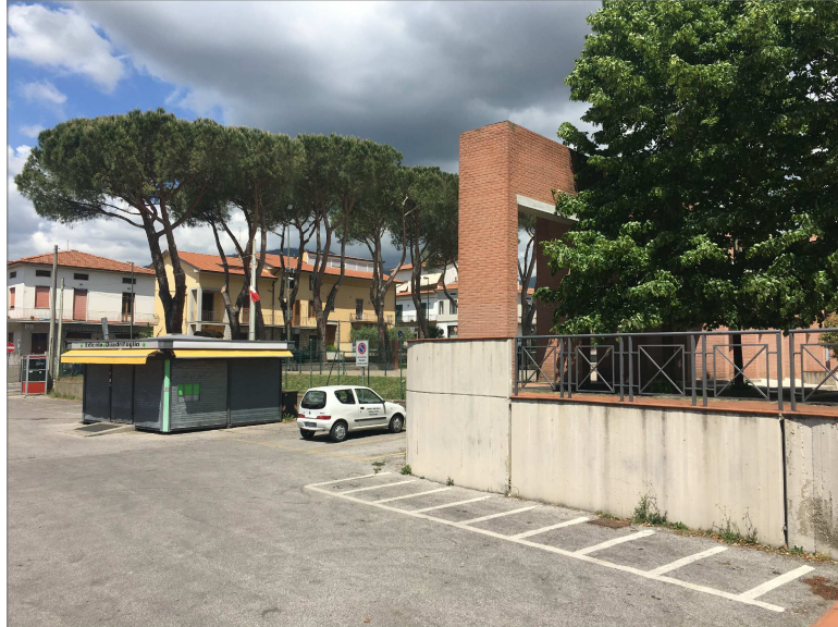
Parcheggio in asfalto