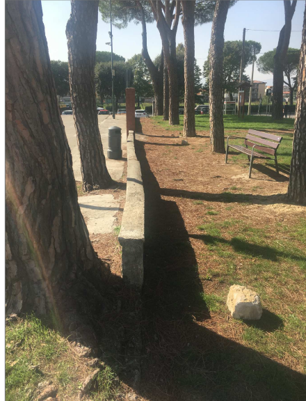
Muro di accesso alla piazza