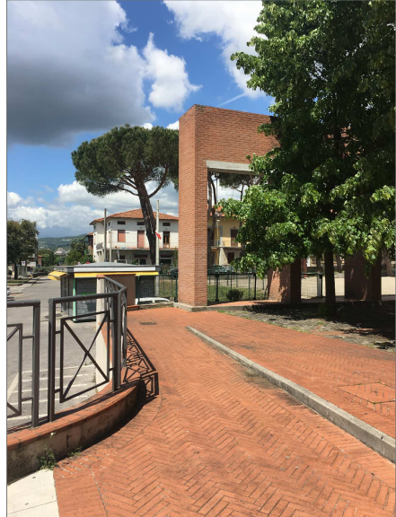
Parapetti in ferro