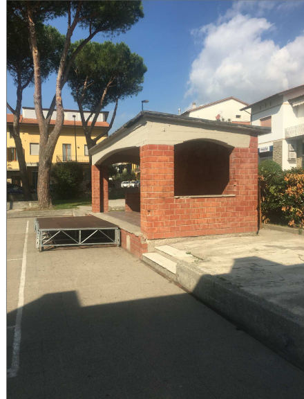
Palco in muratura e relativo basamento