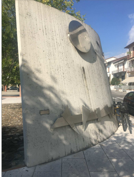
Muro in cemento armato