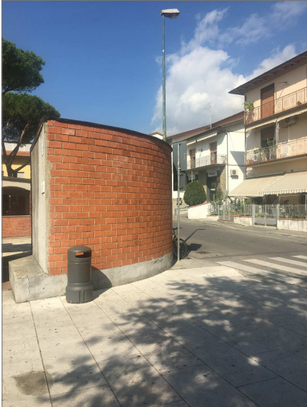
Casottino in muratura