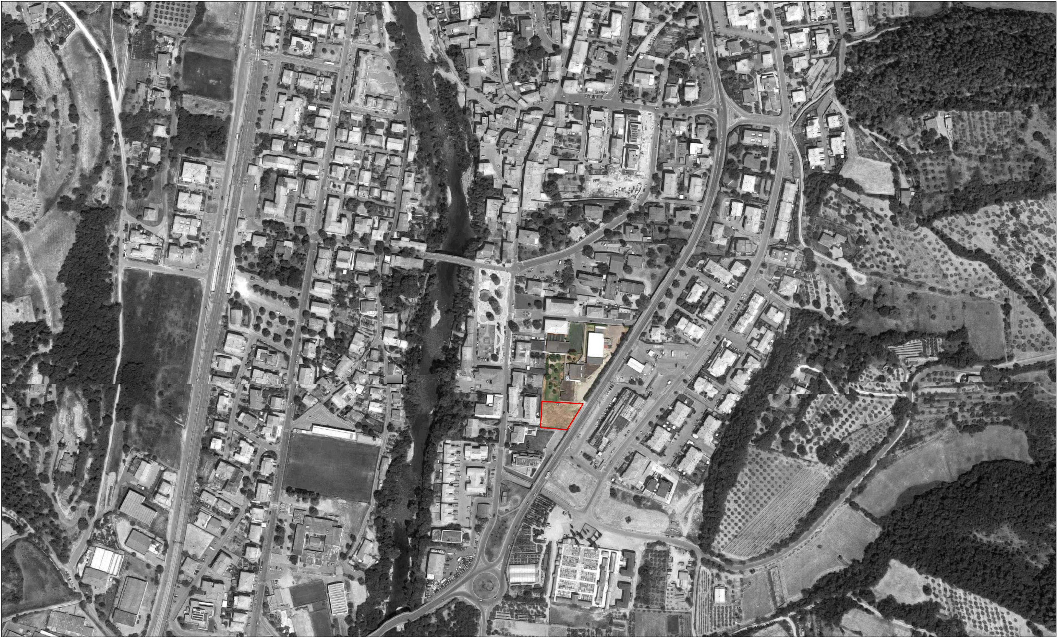
ORTOFOTO — limite area di intervento

TAVOLA AR 01 INQUADRAMENTO GENERALE PE_01_AR_01 STATO DI FATTO SCALA | varie DATA | 31_07_2018