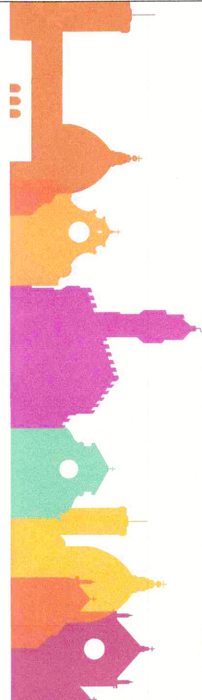
INQUADRAMENTO DI ZONA