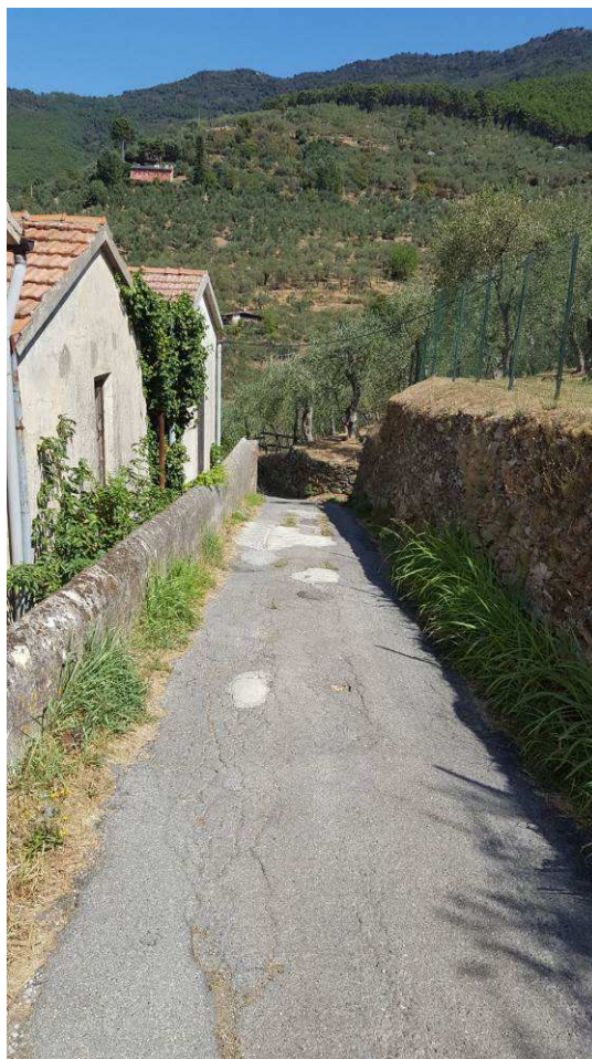
Figura 13 – Assenza di regimazione delle acque nella strada a monte del cimitero