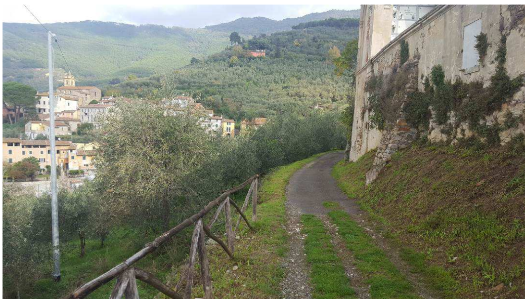
Figura 1 - Vista della strada comunale dal cimitero di San Martino