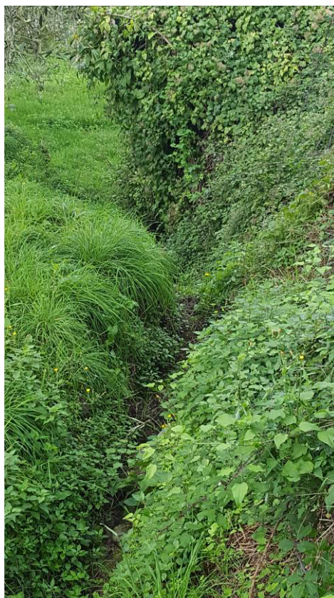
Figura 6 – Vegetazione infestante nell'impluvio a monte del cimitero