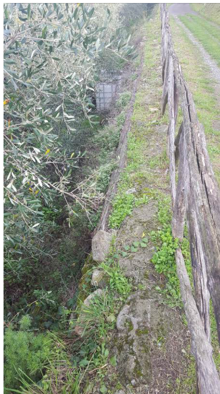
Figura 8 – Muro di sostegno a valle della strada del cimitero