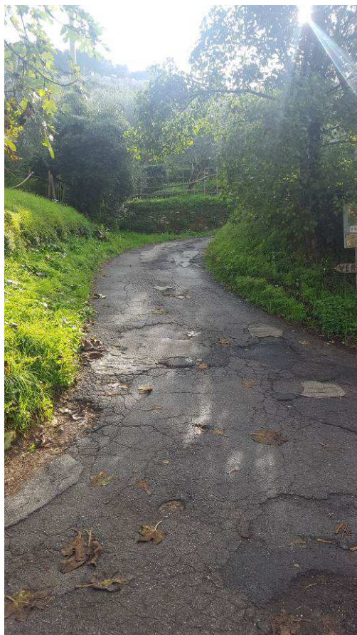
Figura 3 – Immissione della viabilità soprastante sulla via del cimitero di San Martino