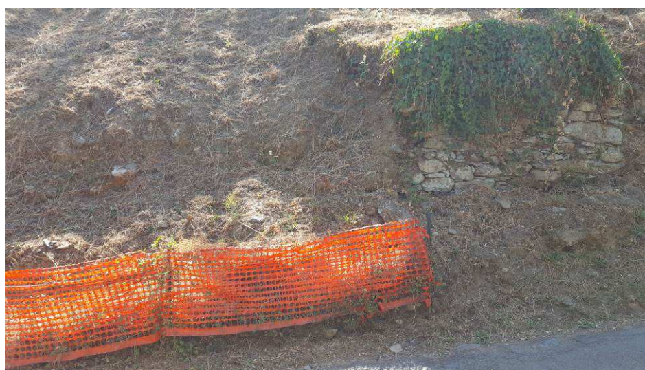
Figura 10 – Particolare del movimento franoso dove realizzare il muro di sostegno su pali