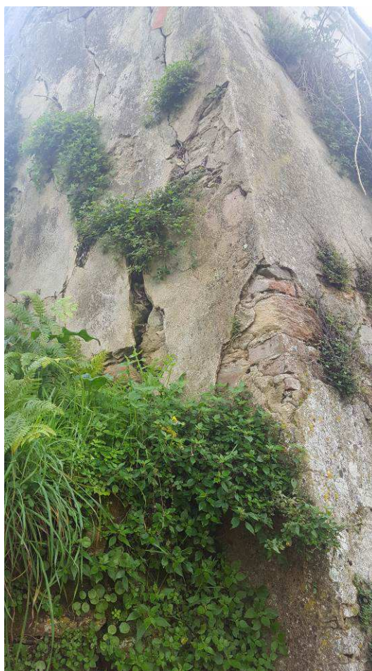
Figura 2 – Lesioni a carico del muro di cinta del cimitero