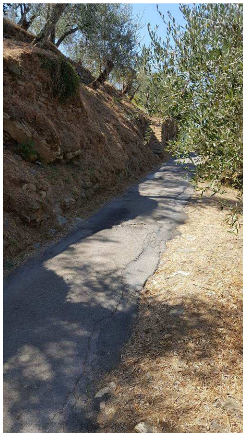
Figura 11 – Particolari delle lesioni a carico della sede stradale