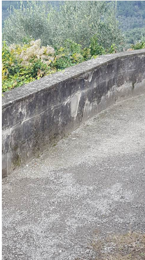
Figura 7 – Movimenti a carico del muro fronte cimitero