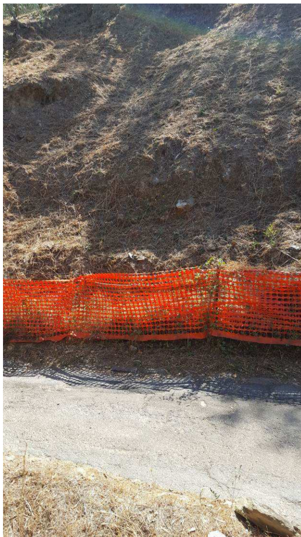
Figura 9 – Movimento franoso dove realizzare il muro di sostegno su pali