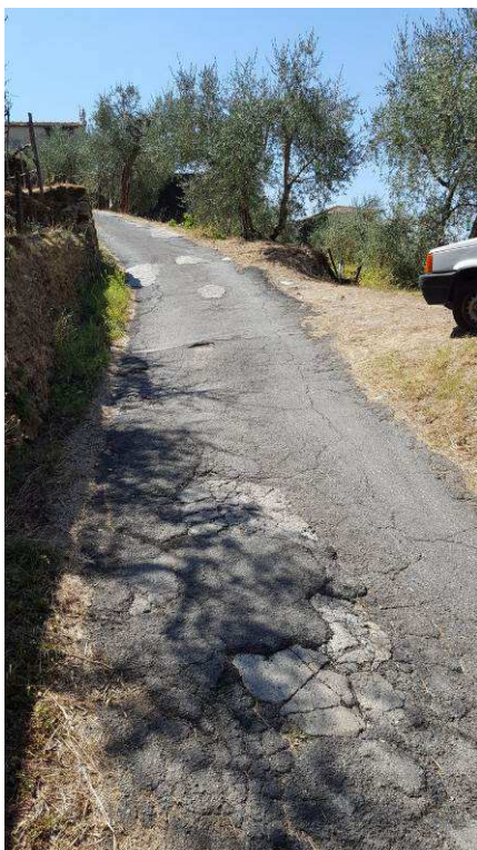
Figura 14 – Evidenti lesioni a causa dei dissesti a carico della strada