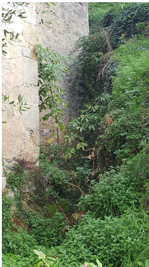
Figura 5 – Vegetazione infestante nell'impluvio di fianco al cimitero