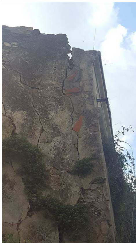
Figura 4 –Particolare delle lesioni sul muro perimetrale del cimitero