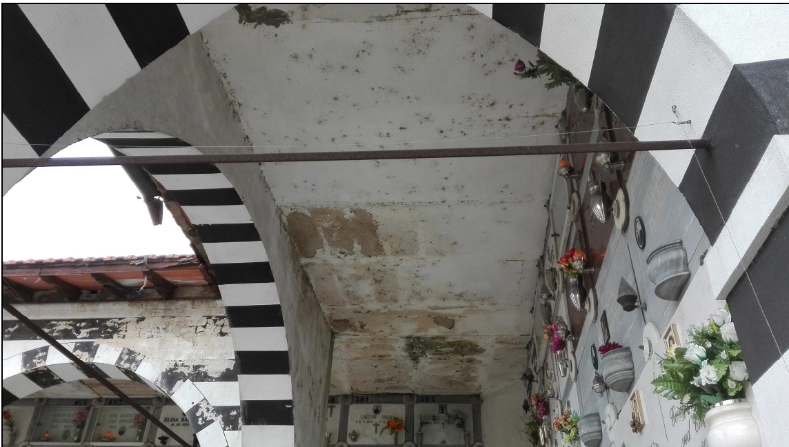
FOTO 1- particolare degrado solaio copertura loggiato piano primo -