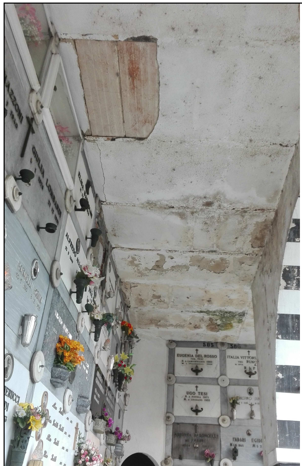
FOTO 3- particolare distacco di intonaco loggiate piano primo -