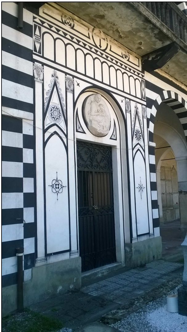
FOTO 5 -particolare infiltrazioni acqua dall'aggetto del solaio del piano primo-