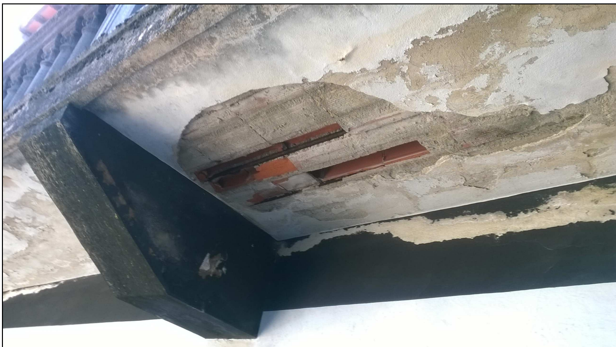
FOTO 4 -particolare sfondellamento aggetto del solaio del piano primo-