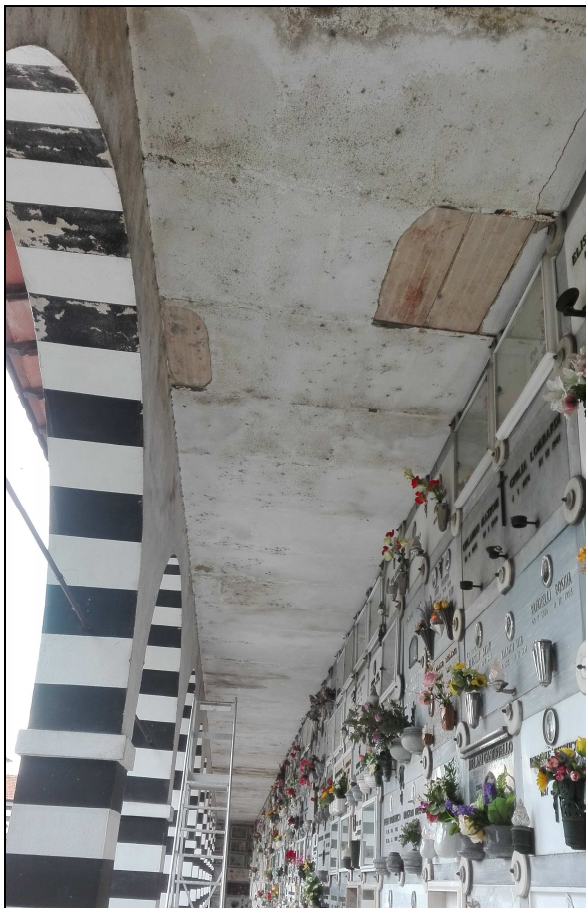
FOTO 2- particolare distacco di intonaco loggiate piano primo -