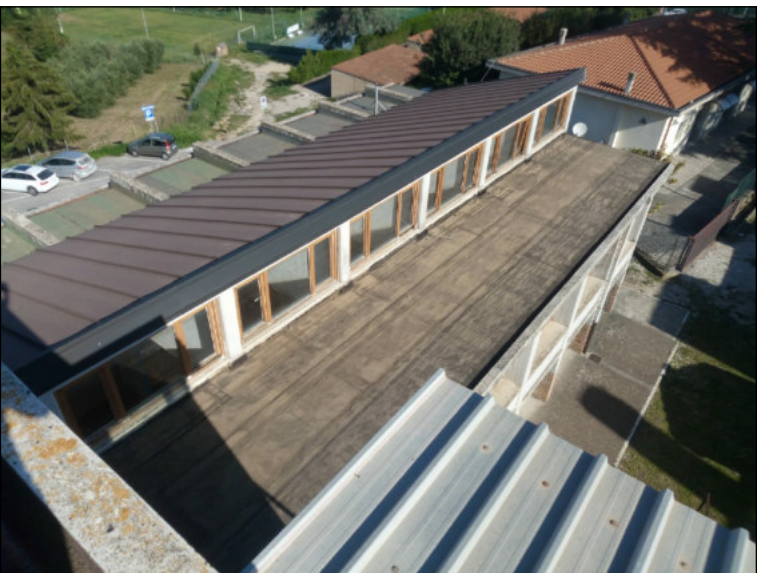
FOTO 9 - Vista copertura plana