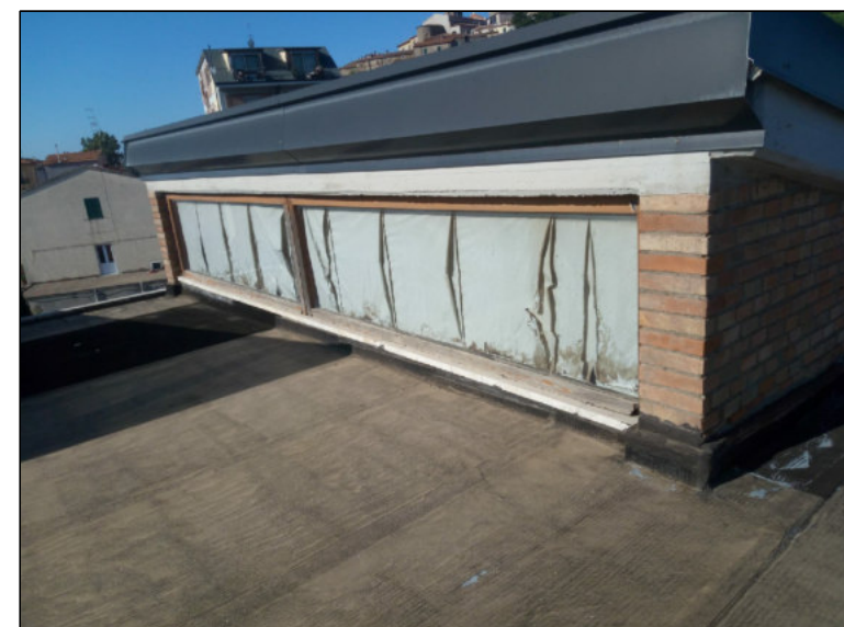
FOTO 11 - Vista infisso A