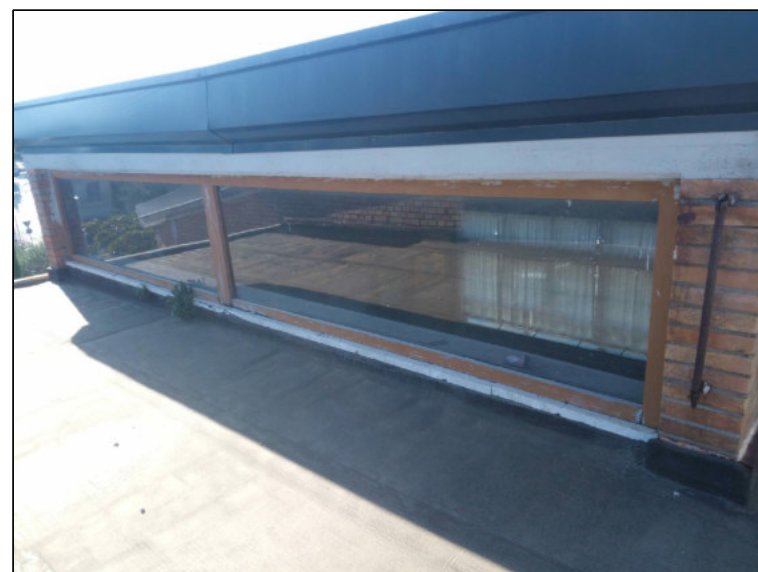
FOTO 12 - Vista infisso B