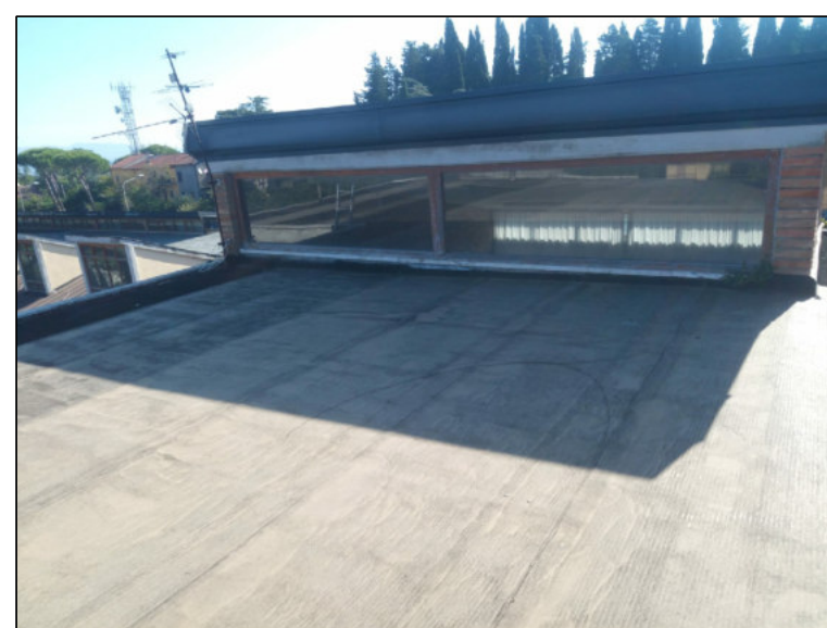
FOTO 13 - Vista infisso C