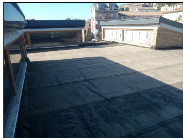
FOTO 10 - Vista infissi A-B-C