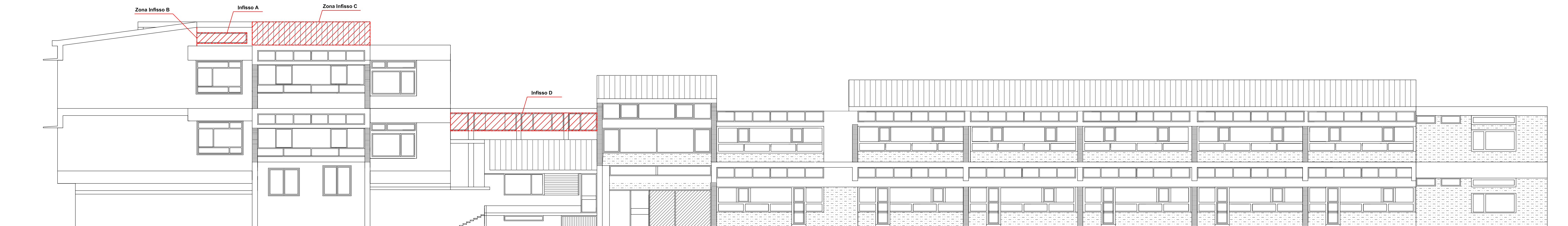
PROSPETTO SULLA STRADA - SCUOLA ELEMENTARE E MEDIA