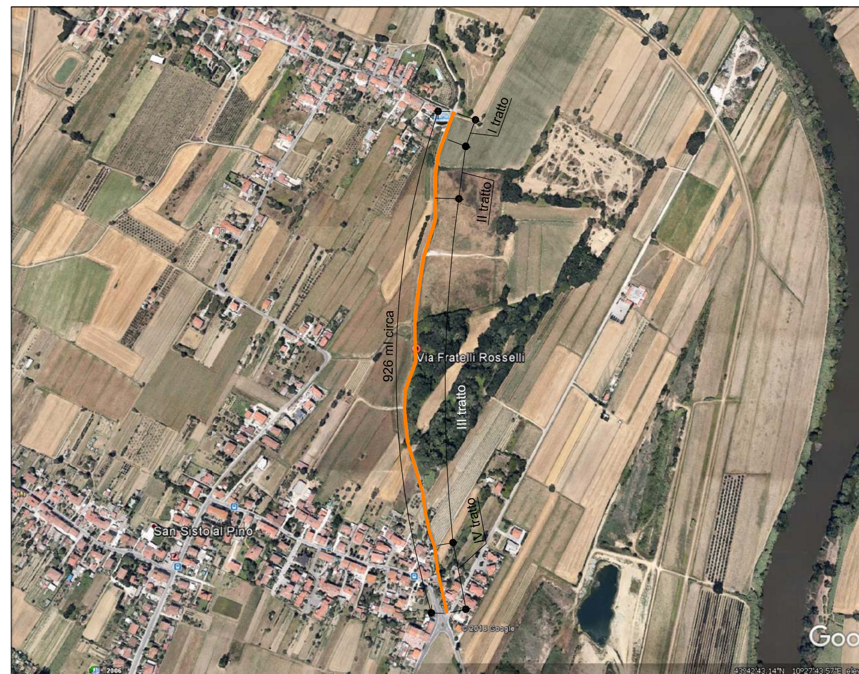
5) TRATTO VIA F.LLI ROSSELLI - LOC. MUSIGLIANO