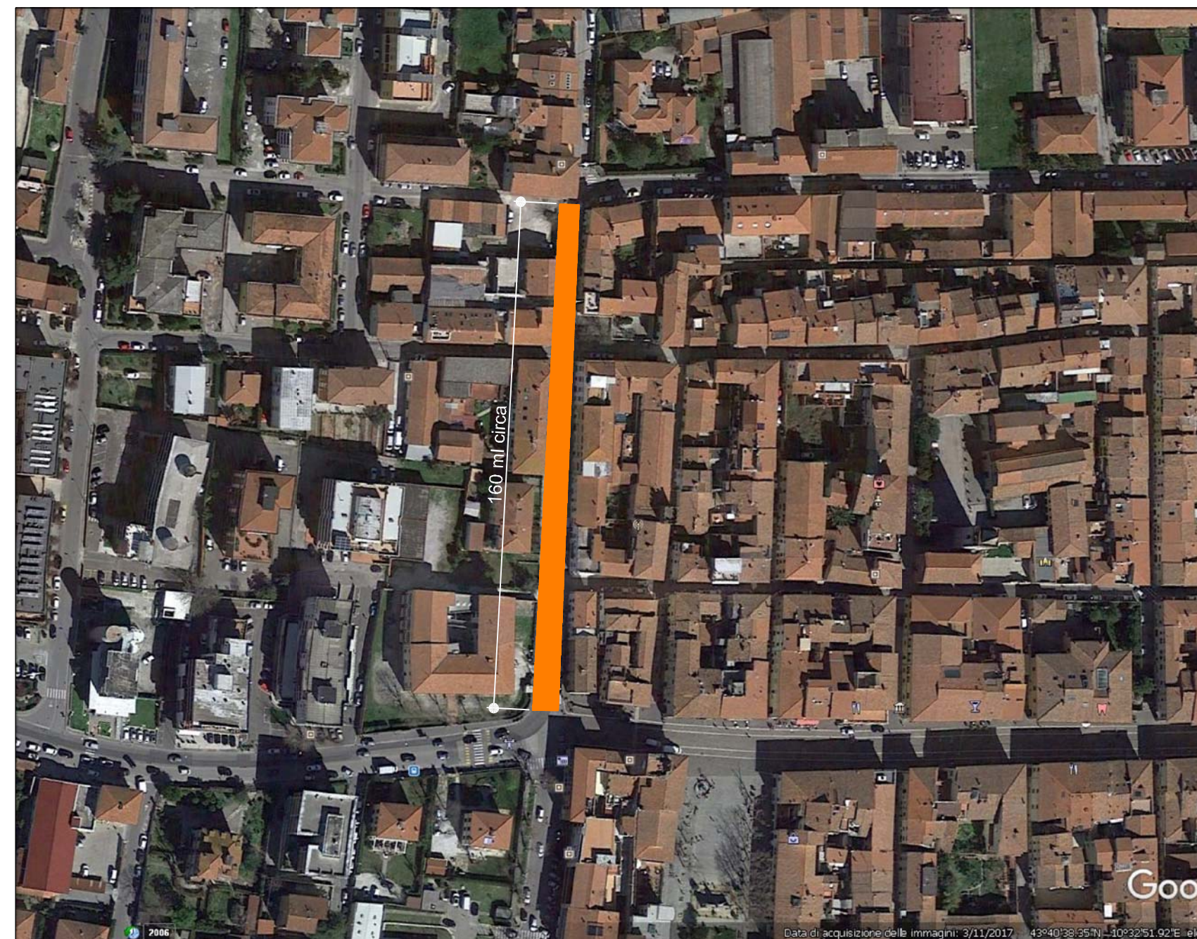
1) TRATTO VIA MICHELANGELO - CASCINA