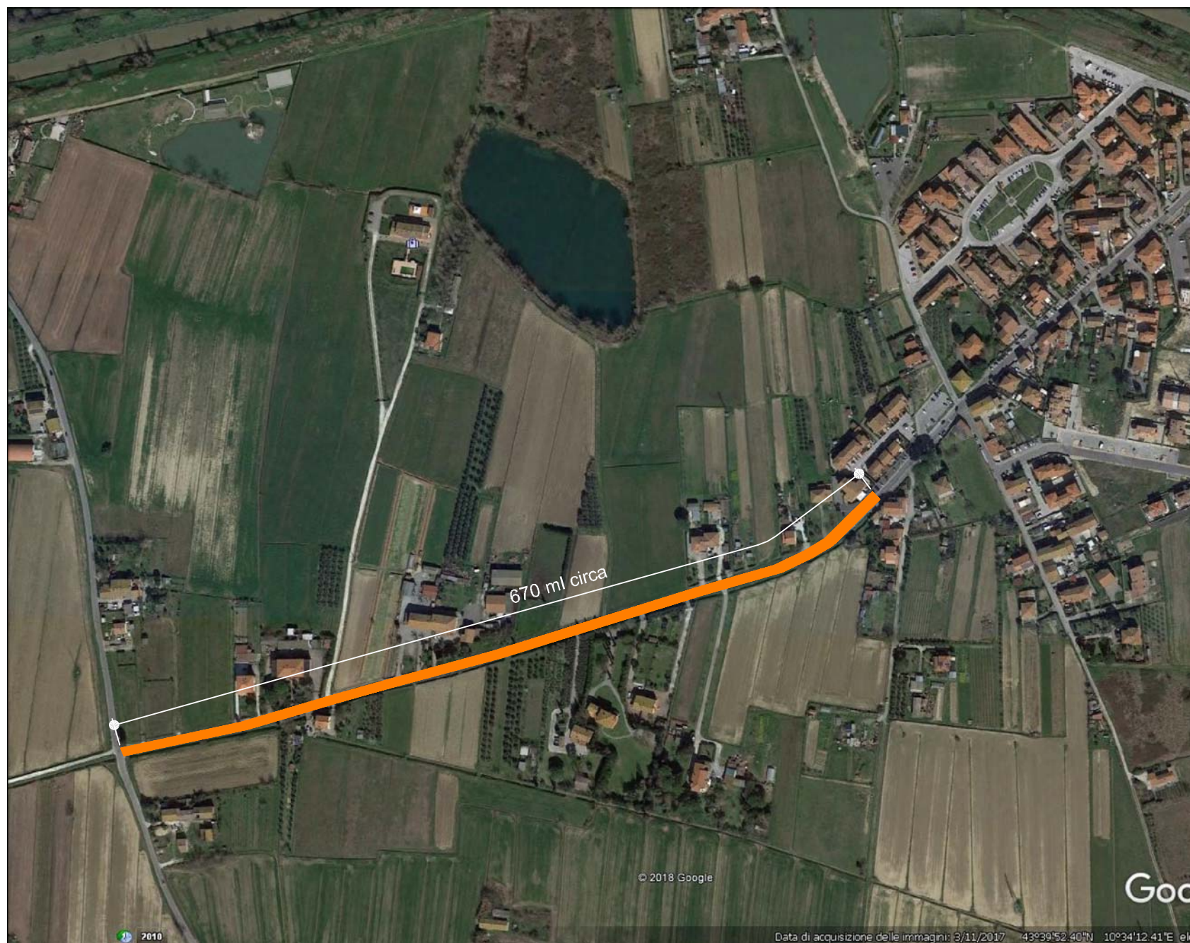
2) TRATTO VIA FOSSO NUOVO - LOC. PARDOSSI