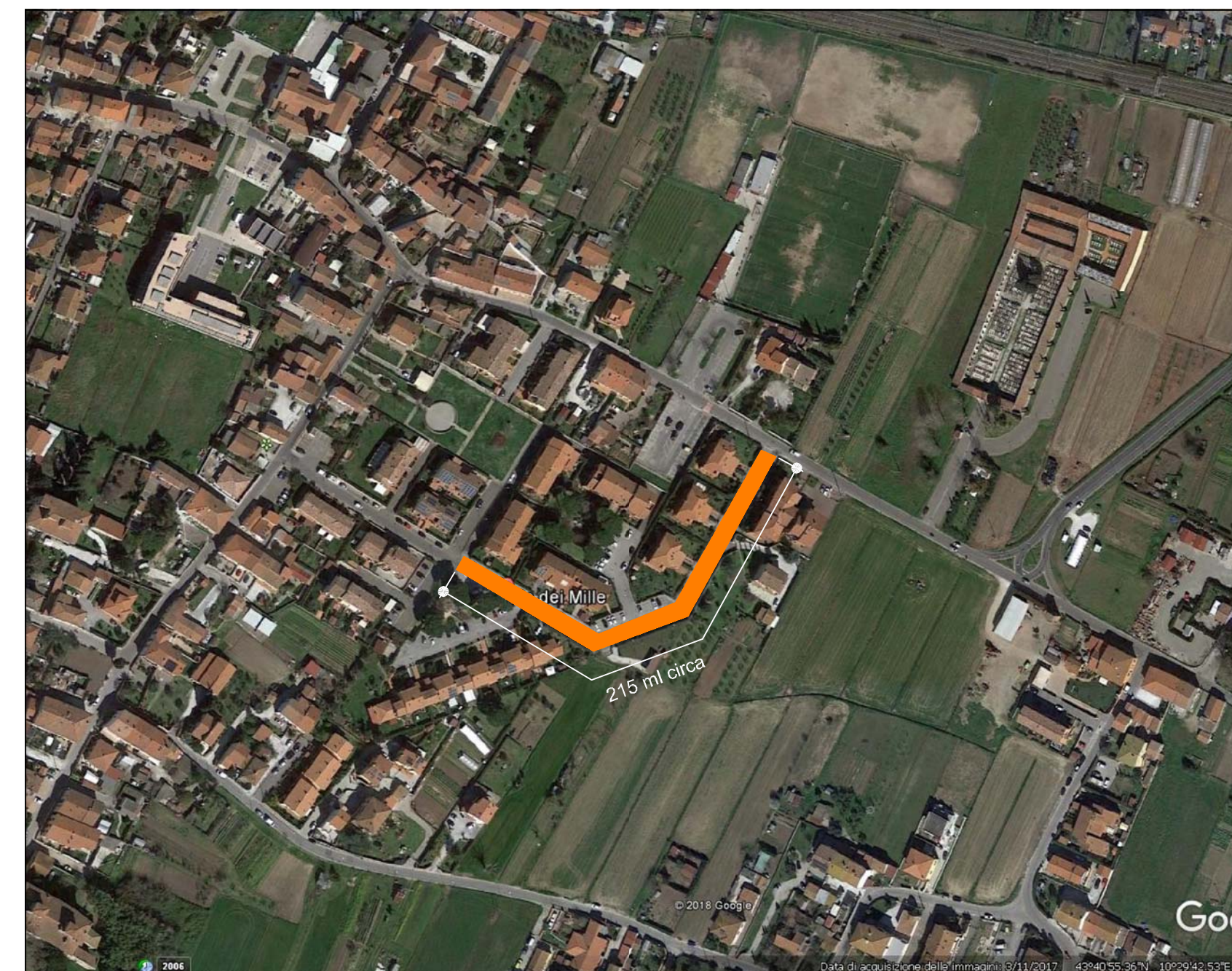
7) TRATTO VIA DEI MILLE - LOC. SAN PROSPERO