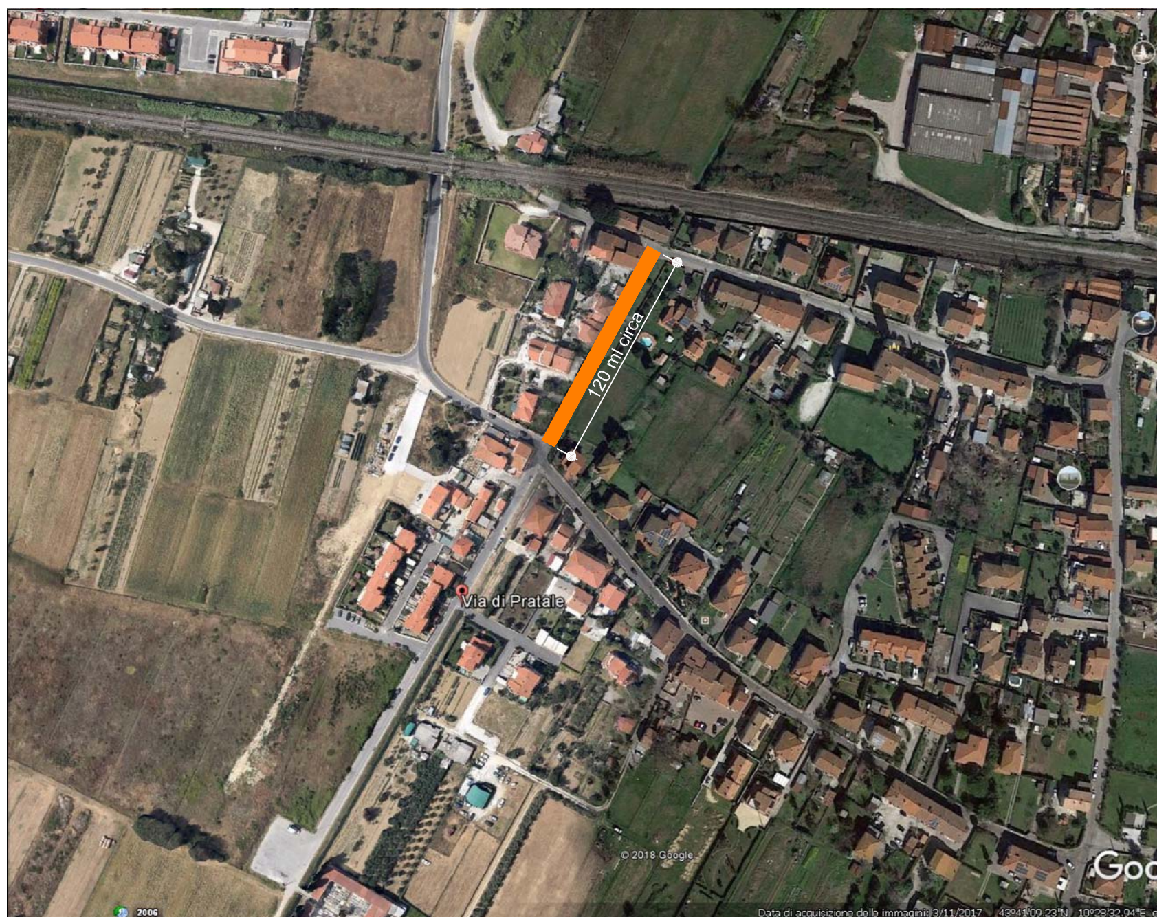
6) TRATTO VIA DI PRATALE - LOC. VISIGNANO