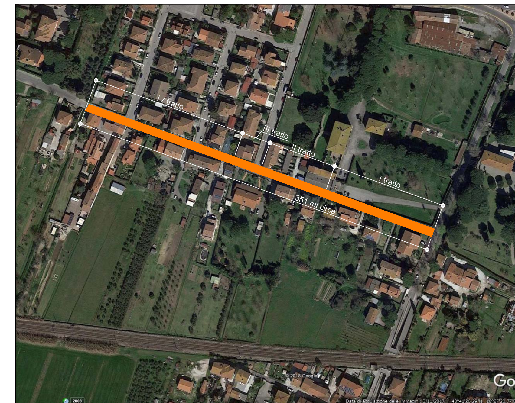
8) TRATTO VIA DI PRATELLO - LOC. TITIGNANO