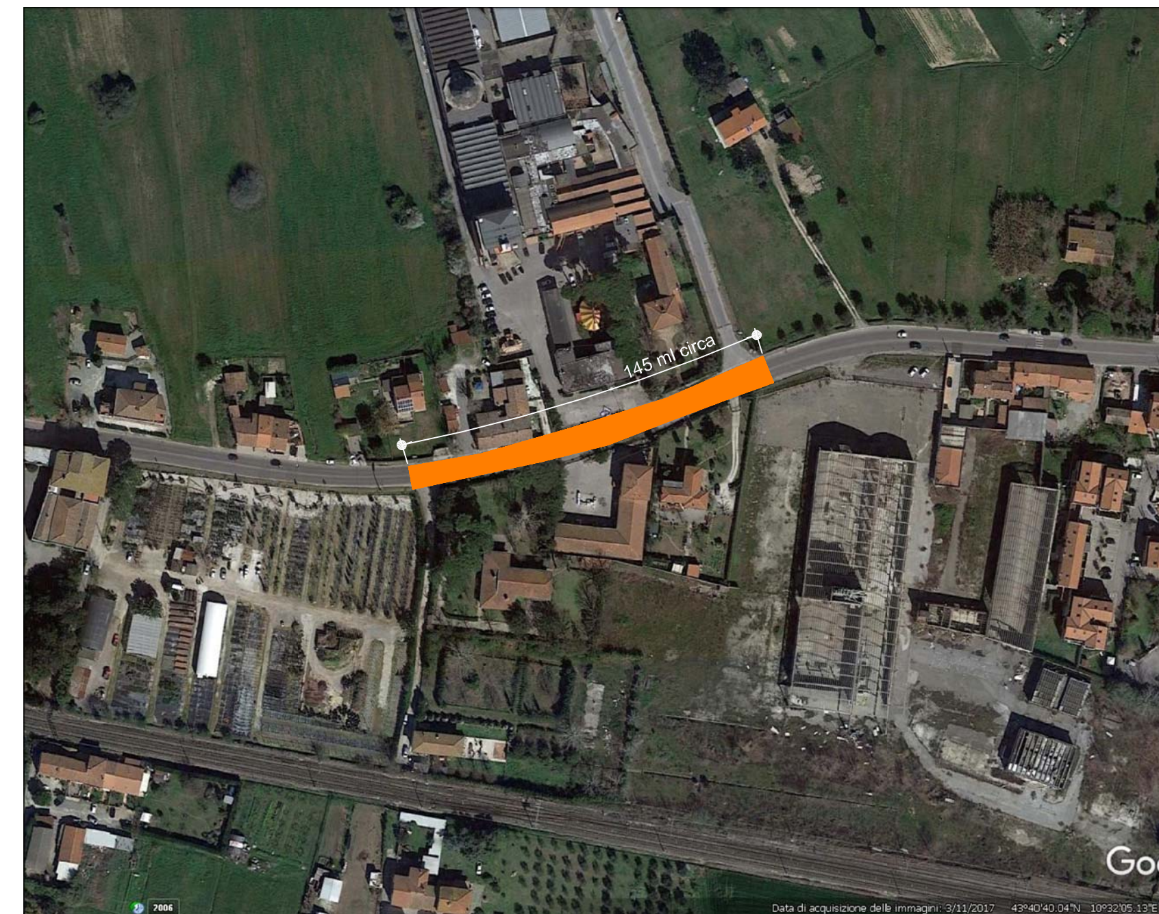
3) TRATTO VIA TOSCO-ROMAGNOLA "POLITEAMA - CITTA' DEL TEATRO"