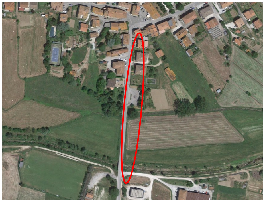
Tratto interessato in loc. Mercatale

Scopo del presente progetto è quello di ottenere un miglioramento della sicurezza stradale, sia pedonale che veicolare, ad oggi sicuramente insufficiente.