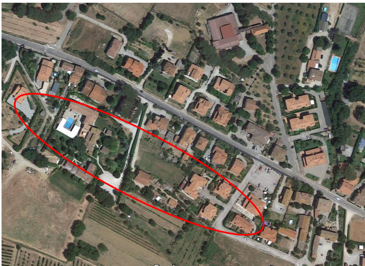
Tratto interessato in loc. Pergo

Scopo del presente progetto è quello di ottenere un miglioramento della sicurezza stradale, sia pedonale che veicolare, ad oggi sicuramente insufficiente.