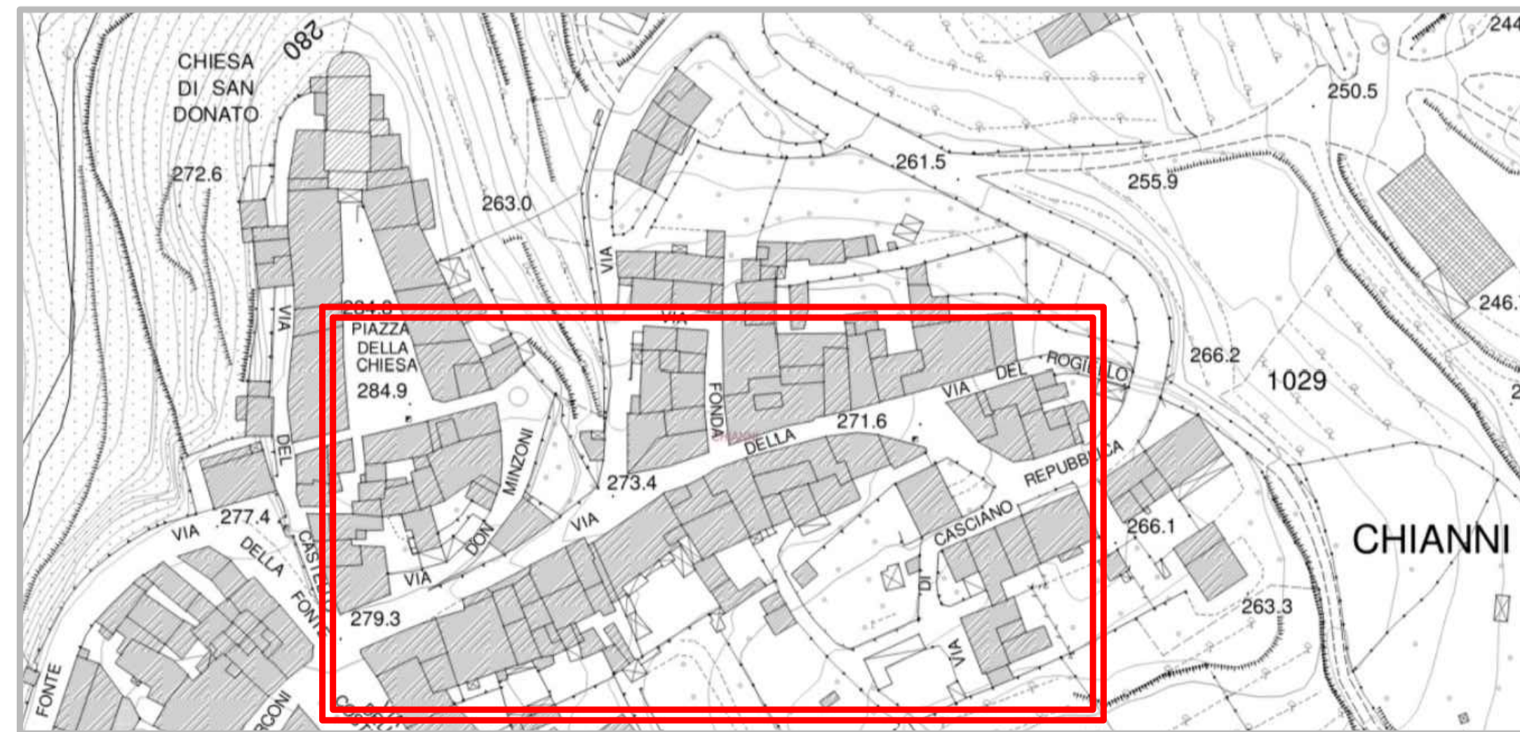
ESTRATTO GEOSCOPIO CARTA TECNICA REGIONALE 1:2000