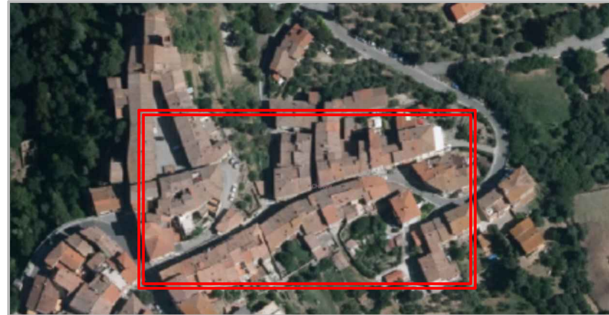
ESTRATTO GEOSCOPIO FOTO 2014 SCALA 1:2000