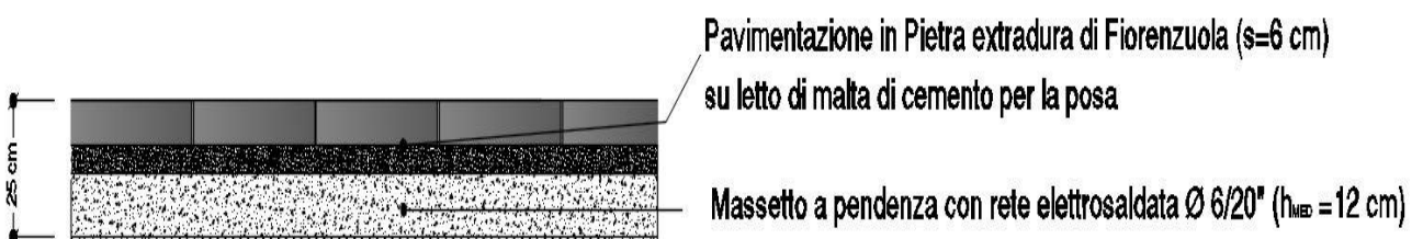
Fig. 2 – Foto Pavimentazione in Pietra Tipo.