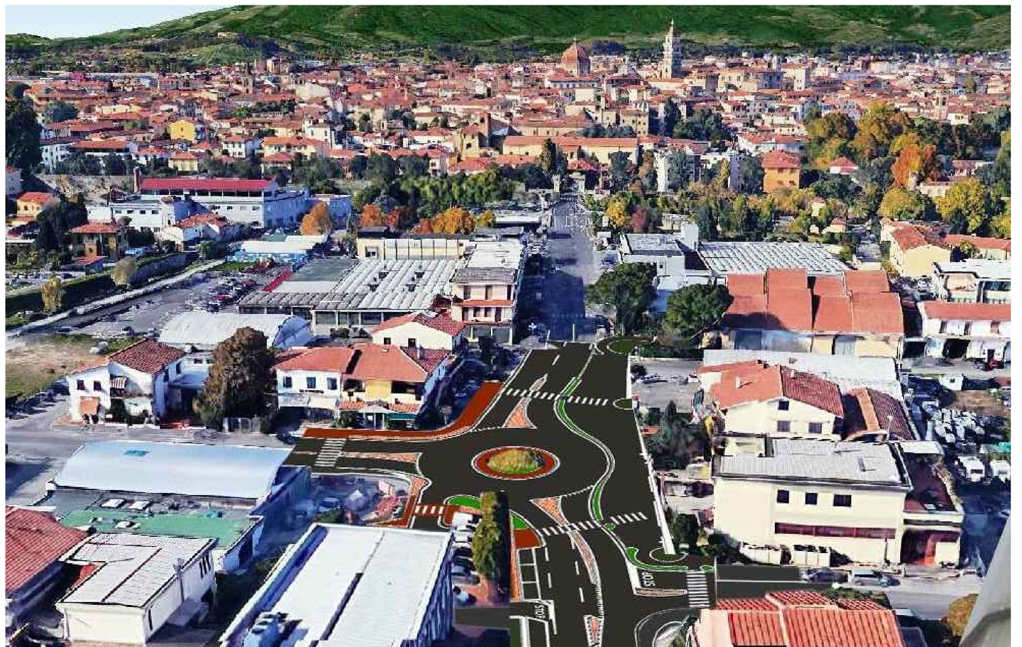
RENDERING di PROGETTO