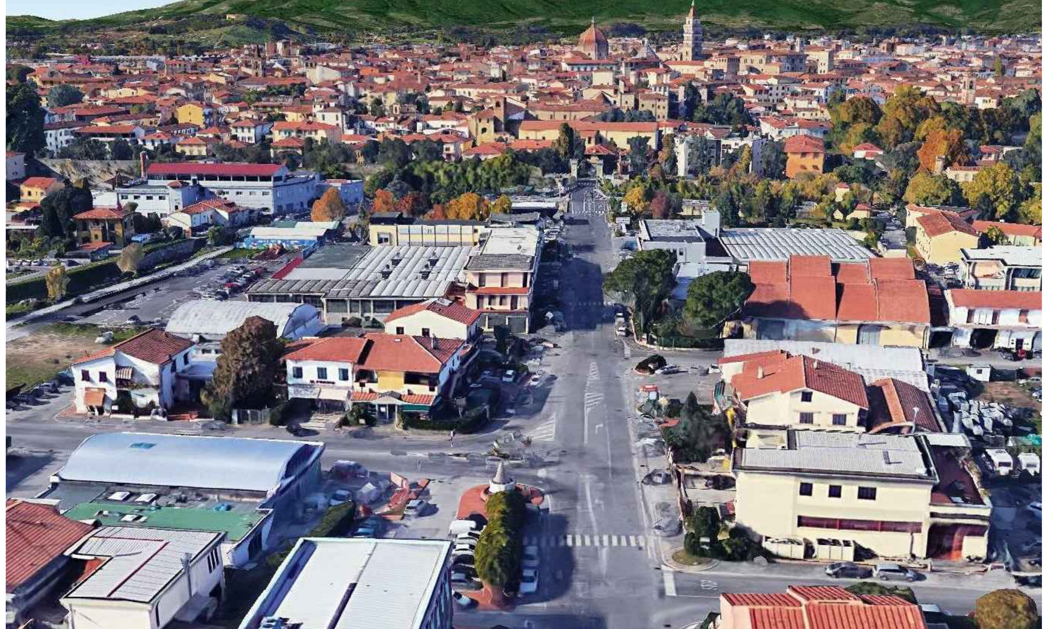
FOTO STATO ATTUALE