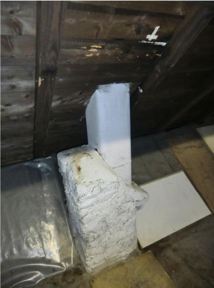
Vista di una delle canne fumarie in cemento amianto (5)