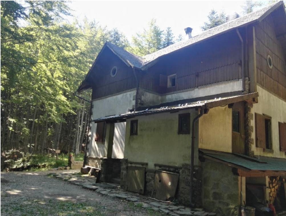
Vista Frontale/ laterale dx (1)