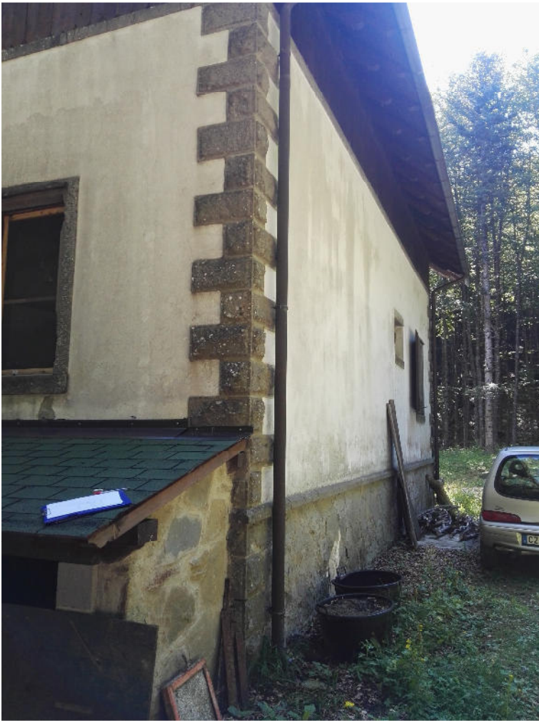
Vista Tergale (3)