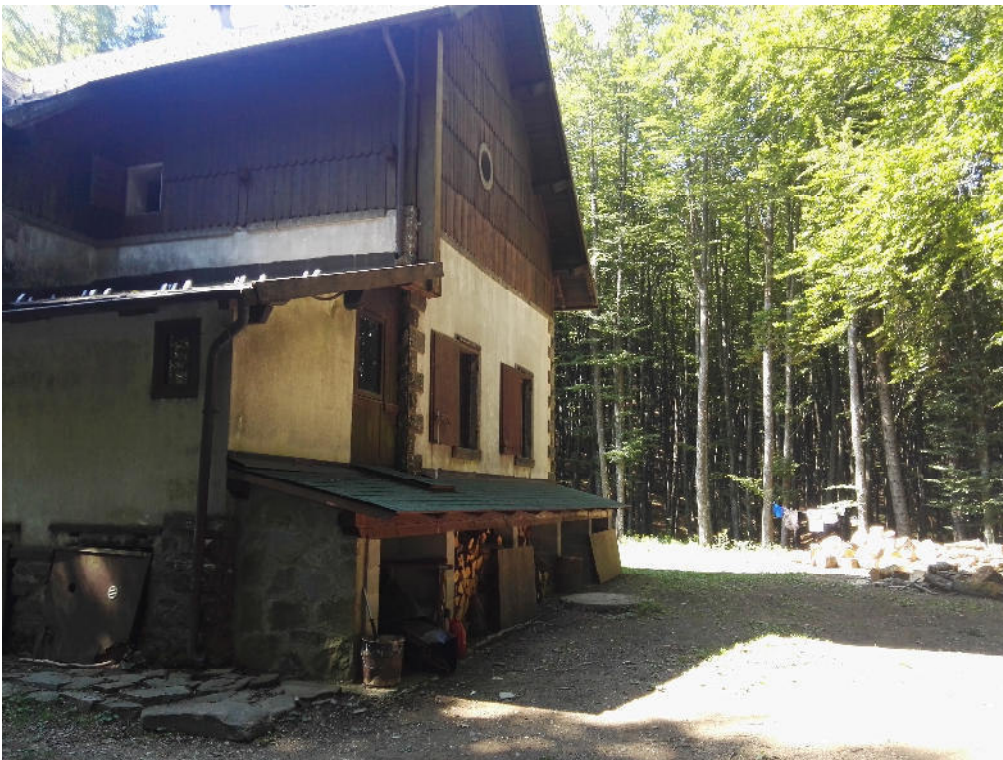
Vista Laterale dx (2)