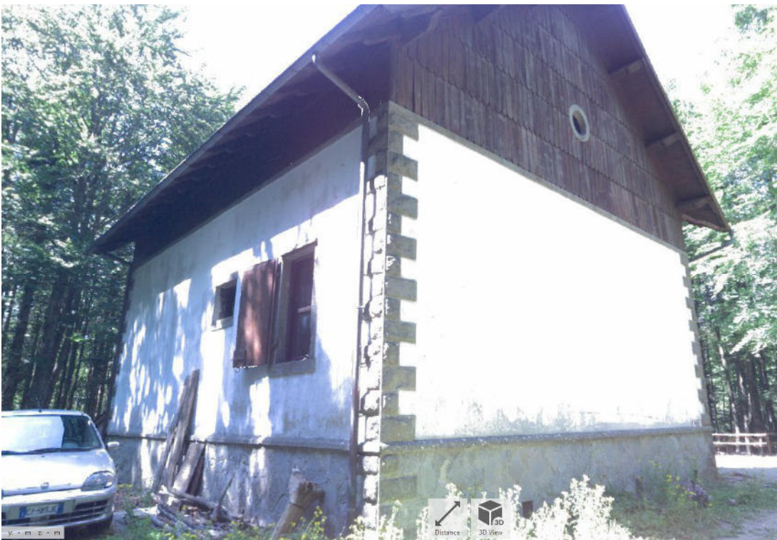
Vista laterale Sx (4)