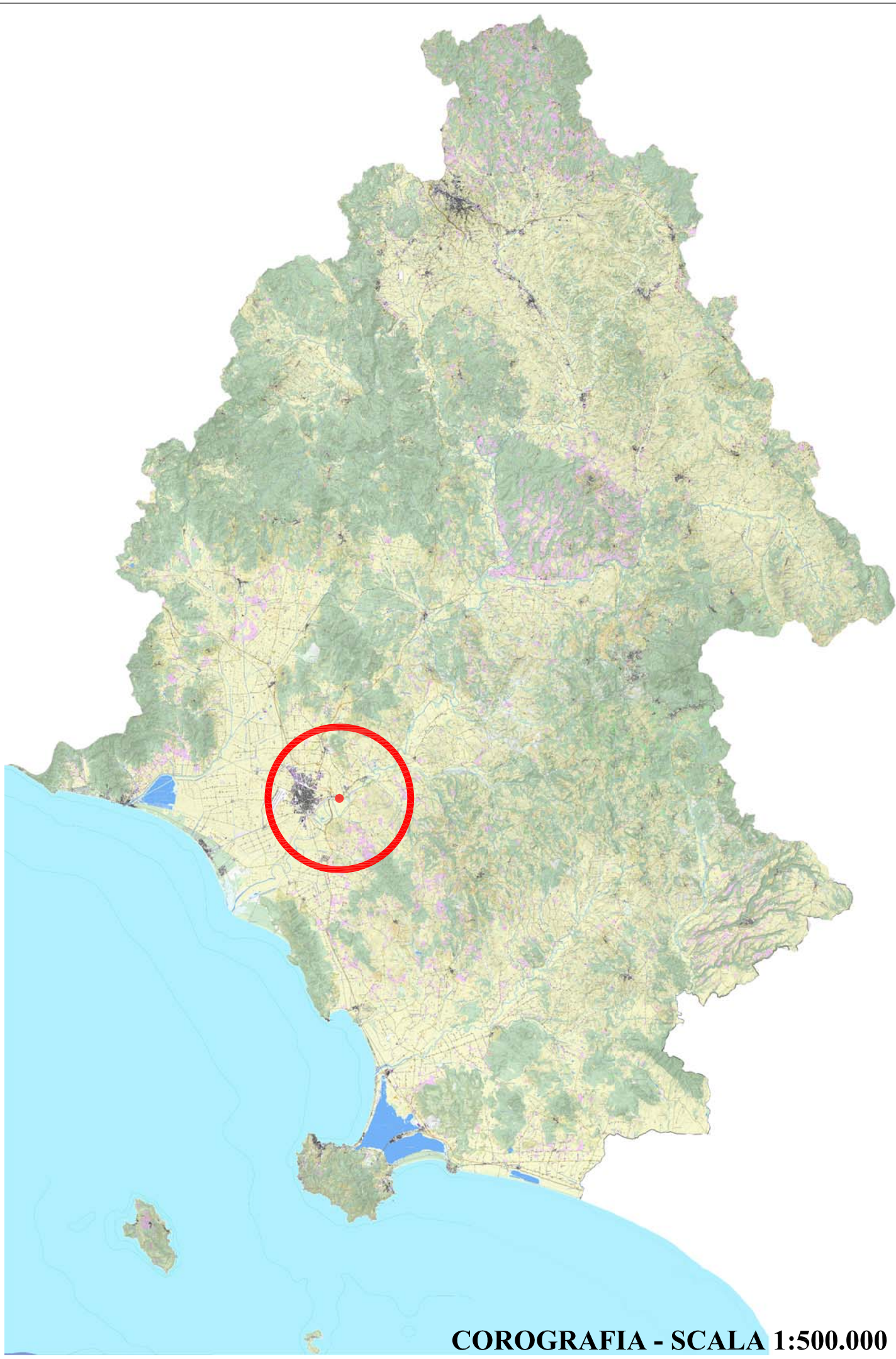
COROGRAFIA - SCALA 1:500.000