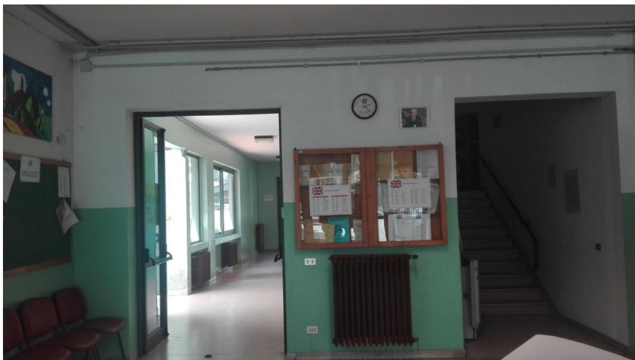
foto 2 - ingresso