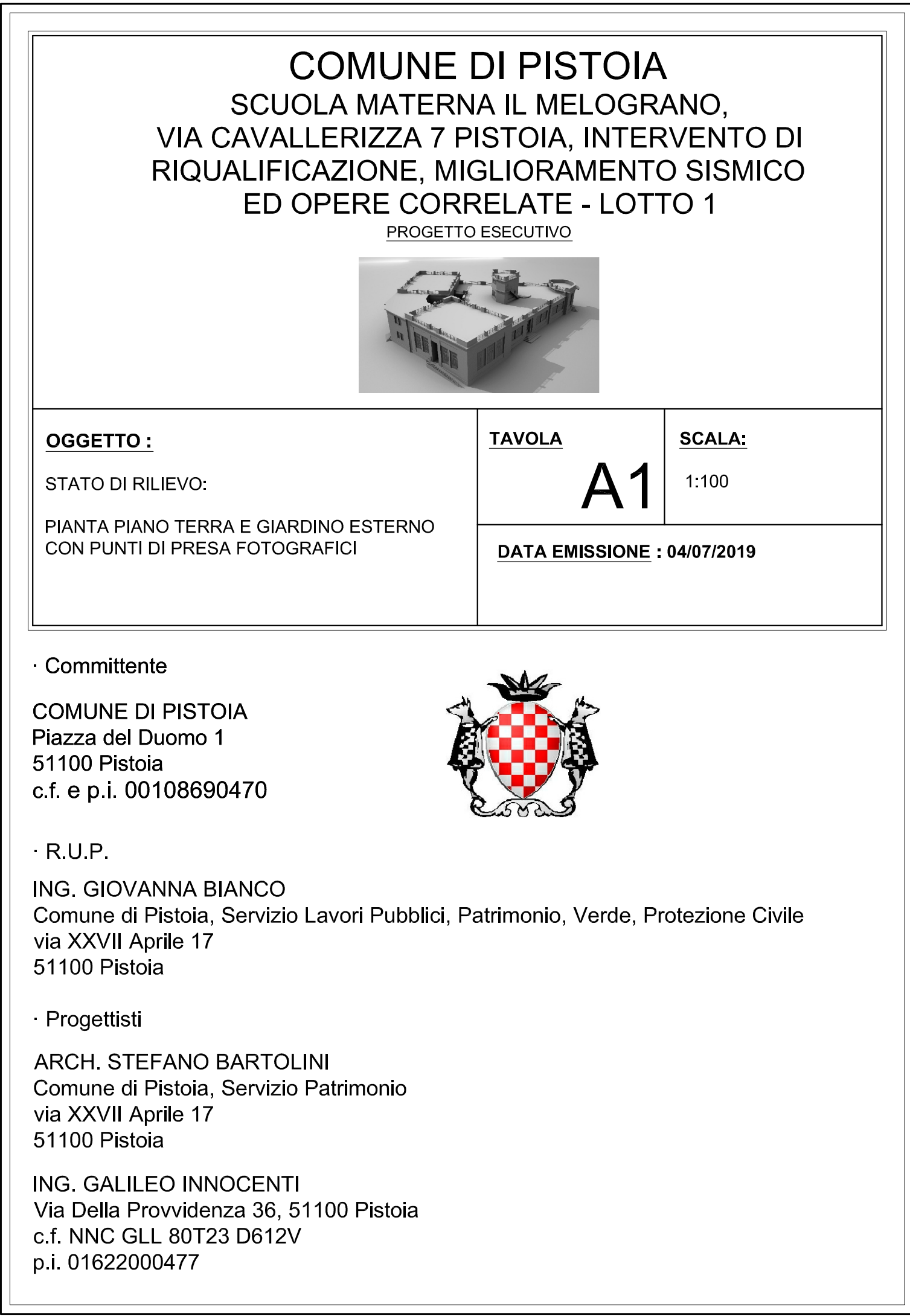
Pianta del piano terra e giardino esterno - Scala 1:100