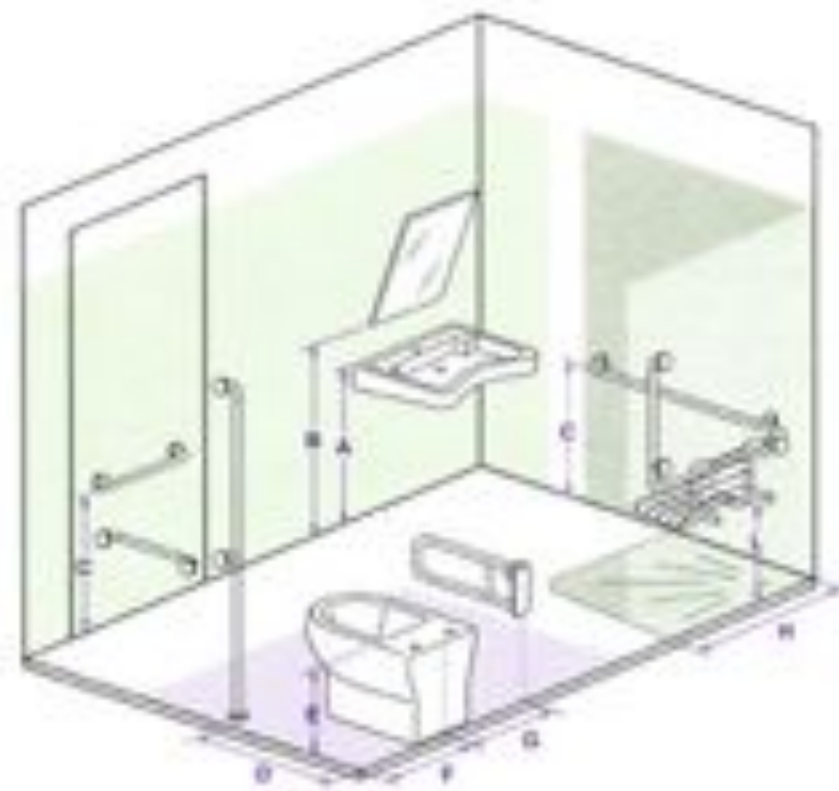
SCHEMA ESEMPLIFICATIVO SERVIZIO IGIENICO ACCESSIBILE