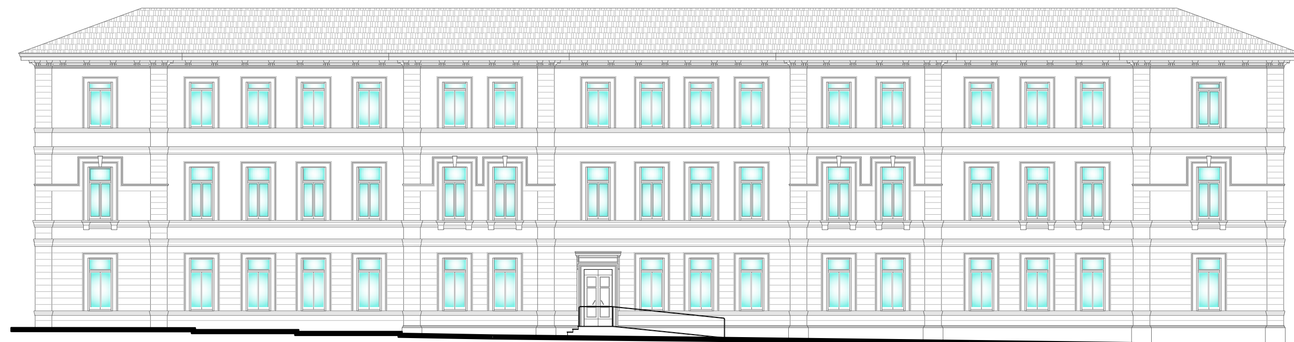
PROSPETTO SUD-OVEST (Via R. Fucini)