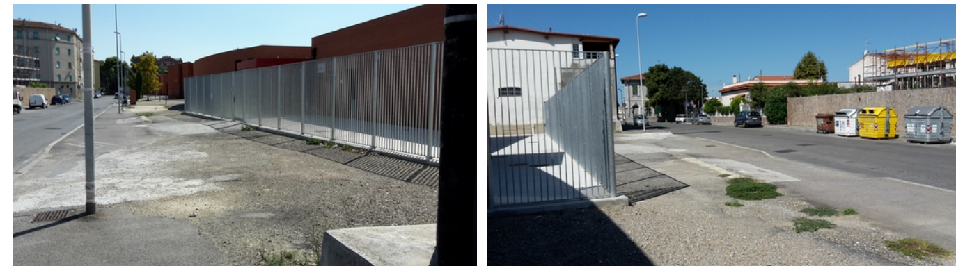
Area dell'intervento: stato attuale