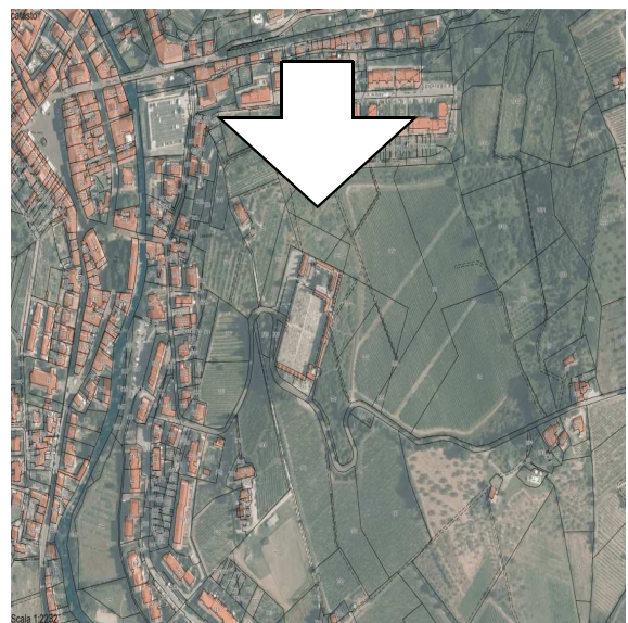
Catasto foto aerea 2013