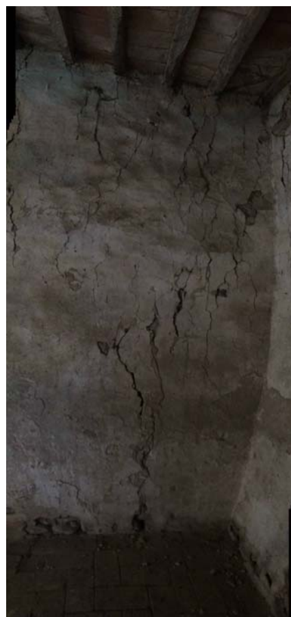
VISTE DEL PIANO TERRA