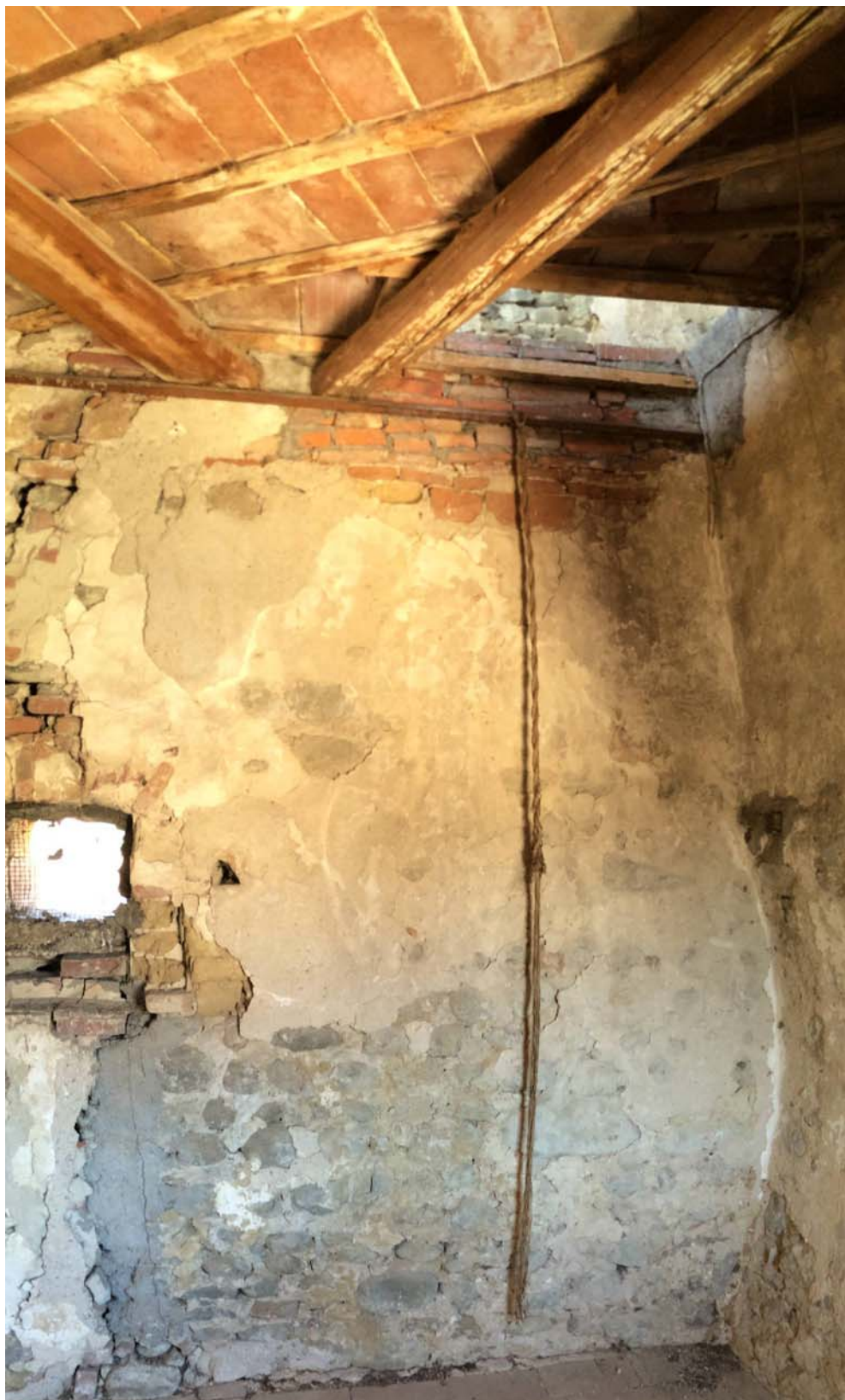
VISTA DEL PIANO TERZO