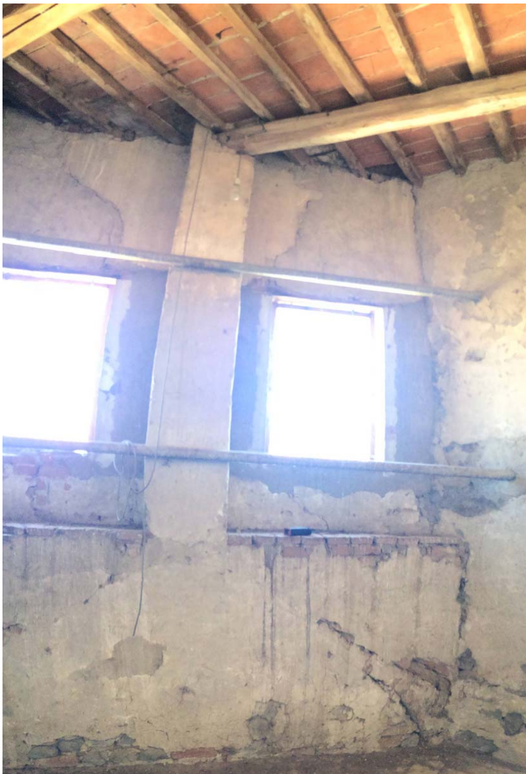
VISTA DEL PIANO SECONDO