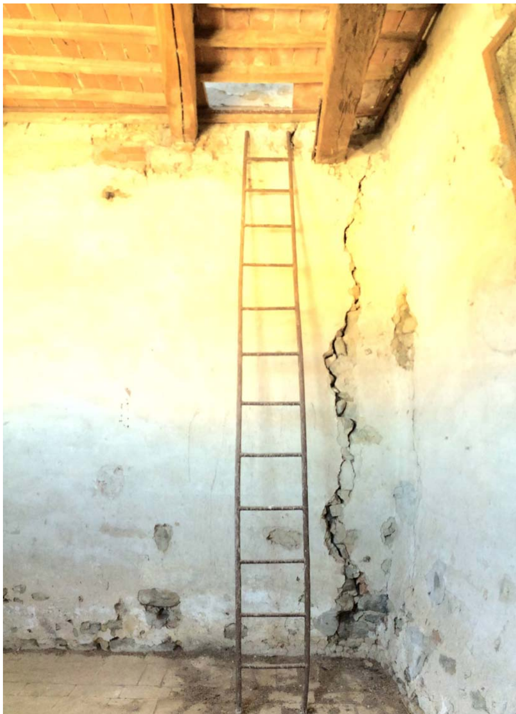
VISTA DEL PIANO SECONDO