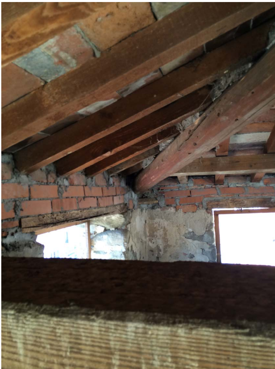
VISTA DEL PIANO QUARTO