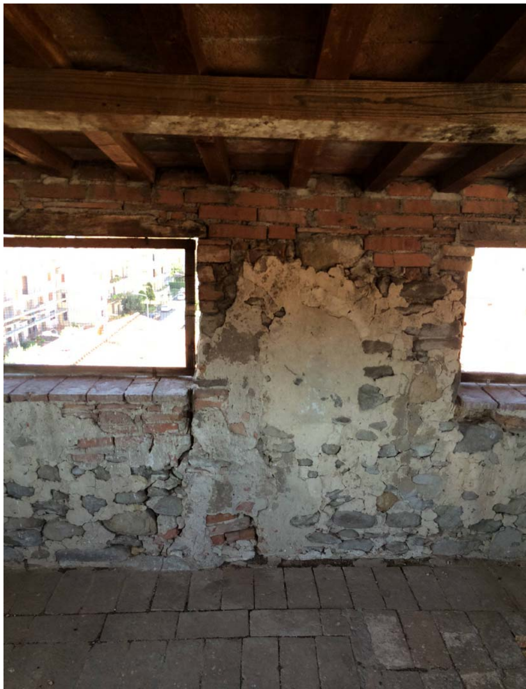
VISTA DEL PIANO QUARTO