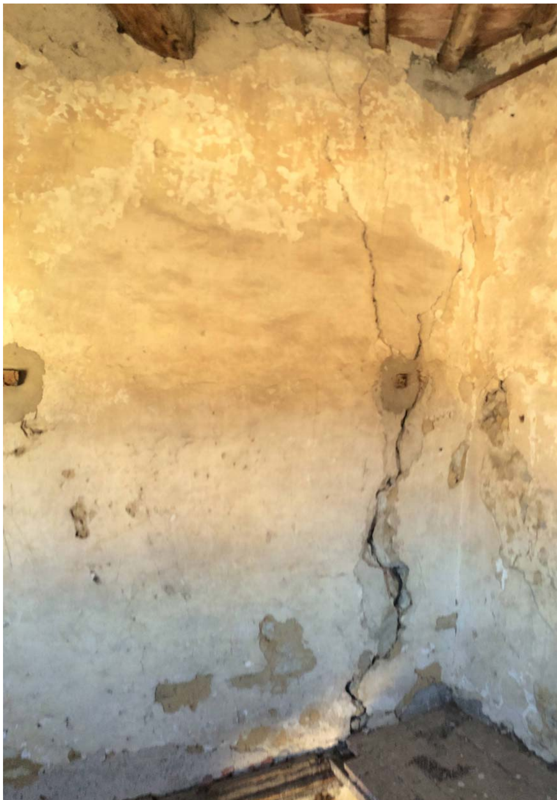
VISTA DEL PIANO TERZO