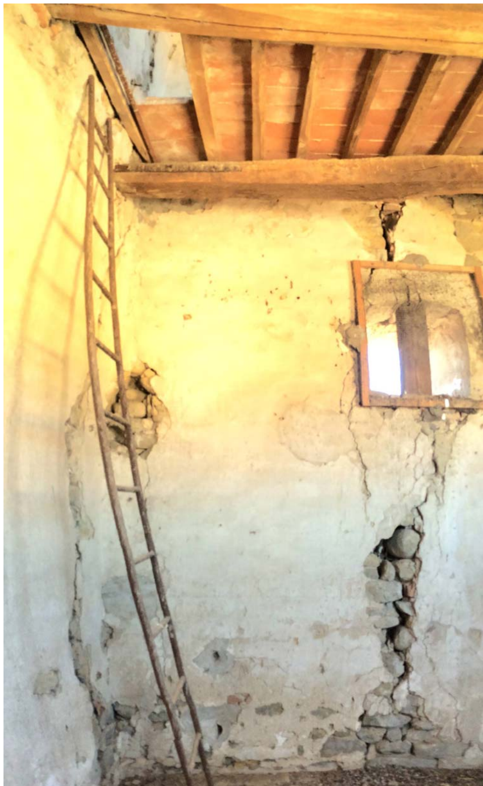
VISTA DEL PIANO SECONDO